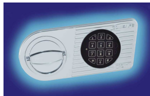
Elektronischschloss mit Klappgriff